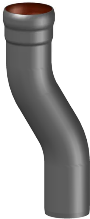
Rohrende leicht eingezogen